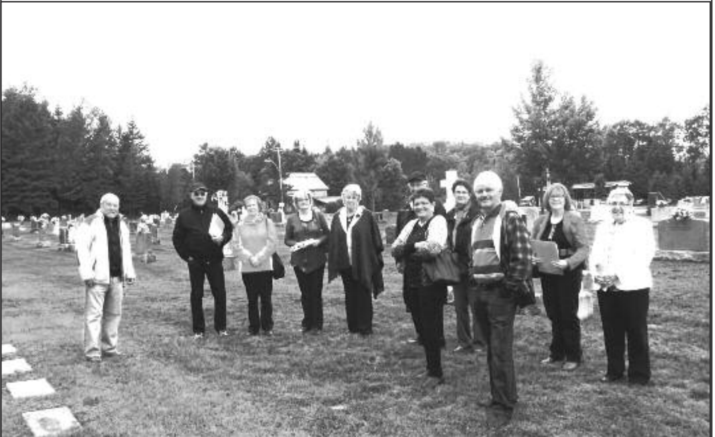
Quelques participants à l'assemblée annuelle du 20 septembre visitent le cimetière de Piopolis

En plus de la présentation du rapport financier et la ratification des actes du conseil pour 2013-2014, une modification est apportée au statut de membre.