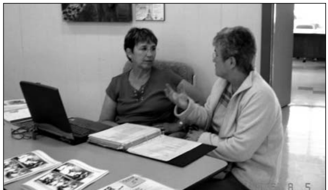
Les 5 et 6 août dernier, la SHGSSF participait au Festival des loisirs de la paroisse en présentant une exposition de photos de mariage et des informations disponibles en tout temps.

Les heureux gagnants du concours: la Société historique et culturelle du Marigot (Longueuil) s'est vu décerner le prix d'excellence 2006 pour la réalisation d'un logiciel multimédia " Longueuil sous le régime français "; le DVD comprend la liste de toutes les personnes qui ont vécu à Longueuil de 1657 à 1765. Nous les félicitons!